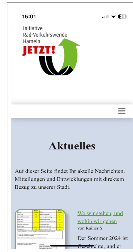
Smart phone: Responsive Design